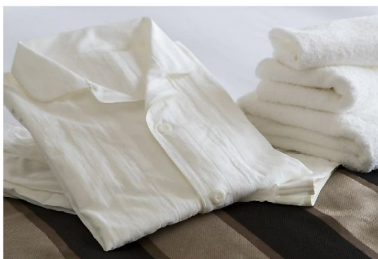
ホテル専用 オリジナルパジャマ(非売品)