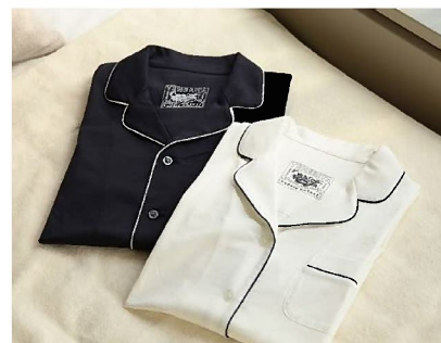
オーガニックコットン 80/2 天竺ジャージパジャマ カラーバリエーションあり。詳しくはお問合せください。 ※写真はイメージです。

プラン特典：①テネリータパジャマをお一人様1着(21,600円相当)プレゼント ②メインバーブエルトにてウエルカムドリンクお一人様1杯ご用意 ③ブッフェ&ラウンジ「ジャルダン」でのモーニングブッフェ または ルームサービスでの朝食 ④レイトチェックアウト 13:00