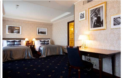
ヨーロッパの街の風景を切り取ったアート。