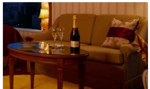
昼から夜へ時間と共に移ろう美しさを体感。