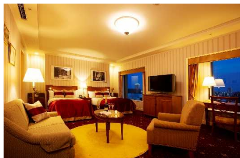
赤・ゴールドを基調としたラグジュアリーなインテリア。