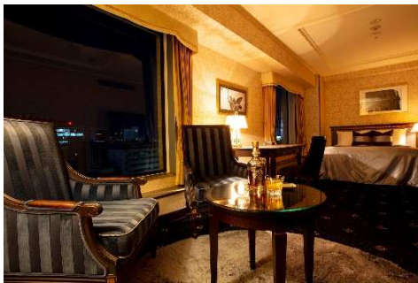
自分だけの時間を、上質な空間で。