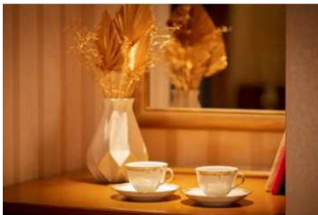
大切な人とのかけがえのない時間を。