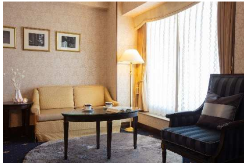
モノトーンを基調としたモダンなインテリア。