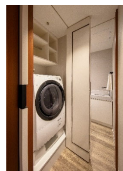
【 室内ランドリー 】

エスパシオクオリティの客室を体感頂けるプランも好評販売中です。1泊でのご利用から長期滞在まで、ハイクラスな滞在を叶える贅沢な空間をご提供いたします。