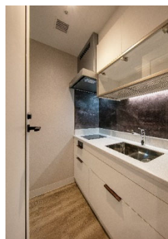
【 室内キッチン 】