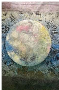
プエルト店内 「月を見る」 *宇宙兄弟 コラボレーション作品 プラチナ箔・銀箔 サイズ：900×600mm