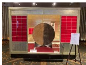
黄金の茶室内 「月光礼賛」 和紙・銀箔 サイズ：直径 1,300mm