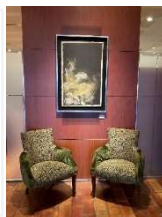
フロント横 「シリウスへの道」 和紙・本金箔・銀箔 サイズ：630×960mm