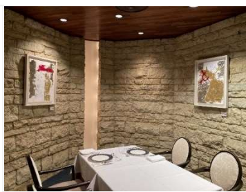
エスコフィエ店内 ■左「白と金と赤」 木・プラチナ箔・本金箔 サイズ：640×760mm ■右「金と赤」 木・プラチナ箔・本金箔 サイズ：610×760mm