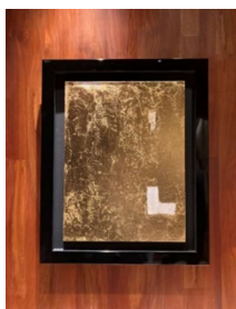
エスコフィエ店内 「Lui Lui」 本金箔 サイズ：775×630mm