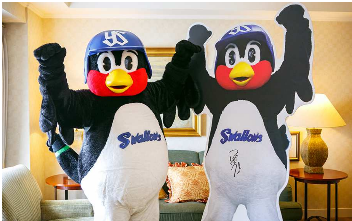
「つば九郎ルーム」を訪れ、等身大パネルと共にポーズをとるつば九郎(左)

客室には、つば九郎と一緒に撮影ができるサイン入り等身大パネルや、つば九郎が着用したユニホーム、つば九郎の写真などを設置し、つば九郎に囲まれる空間を演出するほか、宿泊プラン限定でつば九郎のコメント入りオリジナルグッズもプレゼントいたします。