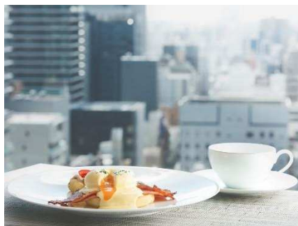
爽やかな朝日に包まれて過ごす寛ぎの朝食