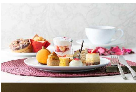
アフタヌーンには宝石のようなスイーツを