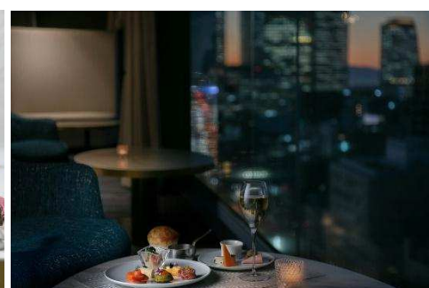
夜景を見ながら優雅なアペリティフを

【 URL 】 https://www.nagoyakankohotel.co.jp/espaciotimesharing/lounge/