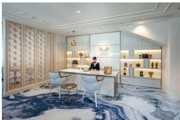
エスパシオラウンジカウンター