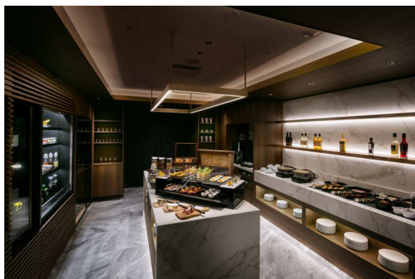
ラウンジバントリー