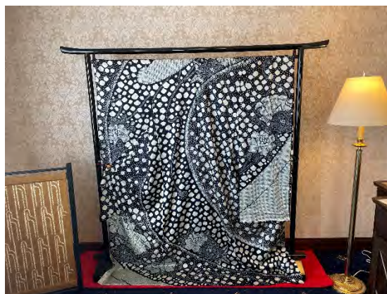
■着物展示 月替わりで総絞りの着物を展示