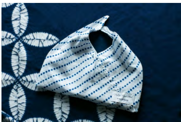
■アメニティポーチ 絞り：豆絞り